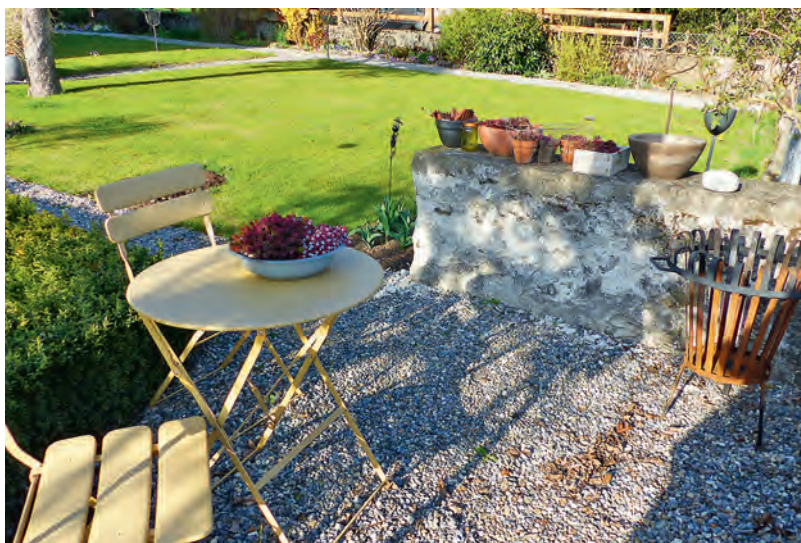
Pfarrhausgarten in Eich.

Vor drei Jahren starteten wir mit dem Versuch, den Garten des Pfarrhauses Eich sporadisch der Öffentlichkeit zugänglich zu machen. Mit ein paar Gartentischen, Festbänken und Sonnenschirmen verwandelte sich der idyllische Ort hinter dem Pfarrhaus stundenweise in einen Begegnungsort mit illustren Menschen.