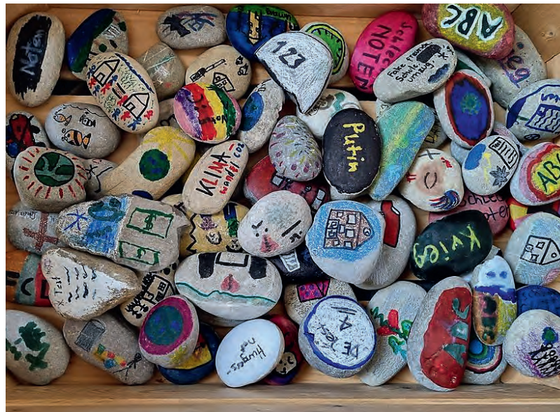
Steine mit Symbolen - bemalt im Religionsunterricht.