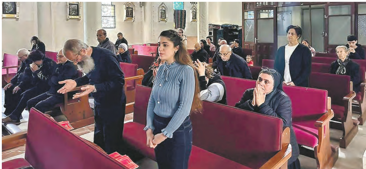
Über 500 Christ/-innen - katholische und orthodoxe - leben auf dem Gelände der Pfarrei «Heilige Familie» in der Stadt Gaza.