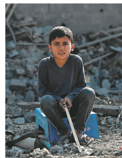
Menschen in Not im Gazastreifen. Auch Kinder sind betroffen.