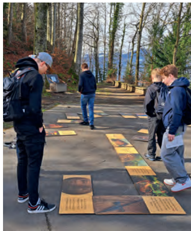
Rätselspass im Flüeli-Ranft

Gemütliche – in der Jugendsprache das Chillige – natürlich nicht fehlen. Ob am See in Zug, in der Verenschlucht in Solothurn oder am Ufer der Melchaa im Ranft. Das gemeinsame Mittagessen genossen alle in der jeweiligen Gruppe. Am Abend trafen sich dann die Firmand/-innen in der Wallfahrtskapelle Neuenkirch zum gemeinsamen Abschluss. Es wurde sichtbar, dass trotz der unterschiedlichen Ausrichtungen der Ausflüge die Gemeinschaft in allen Gruppen eine Stärkung erhielt.