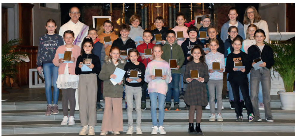
Kinder aus Rain mit ihrem persönlichen Spiegel.

Am Samstag, 9. März, waren 28 Kinder der 4. Klasse in Rain und am Samstag, 16. März, 16 Kinder der 4. Klasse in Hildisrieden auf dem Versöhnungsweg. Mit einer Vertrauensperson ihrer Wahl haben sie sich auf den rund zweistündigen Weg begeben, der mit der Zusage auf Versöhnung im Gottesdienst abschloss.