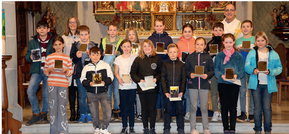
Die Kinder der 4. Klas- sen aus Hildisrieden, den Spiegel in ihren Händen haltend.